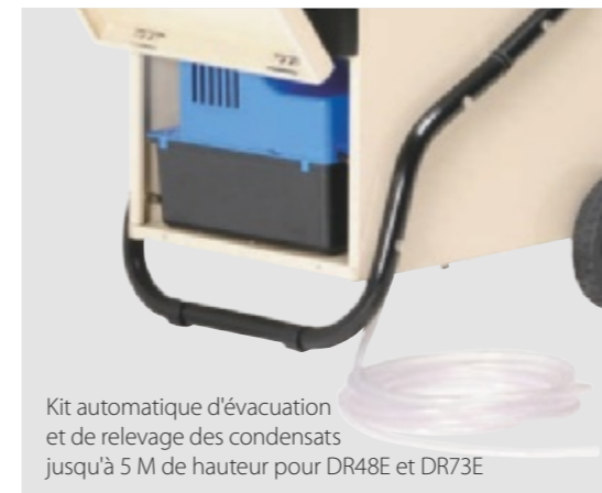
Kit automatique d'évacuation et de relevage des condensats jusqu'à 5 M de hauteur pour DR48E et DR73E